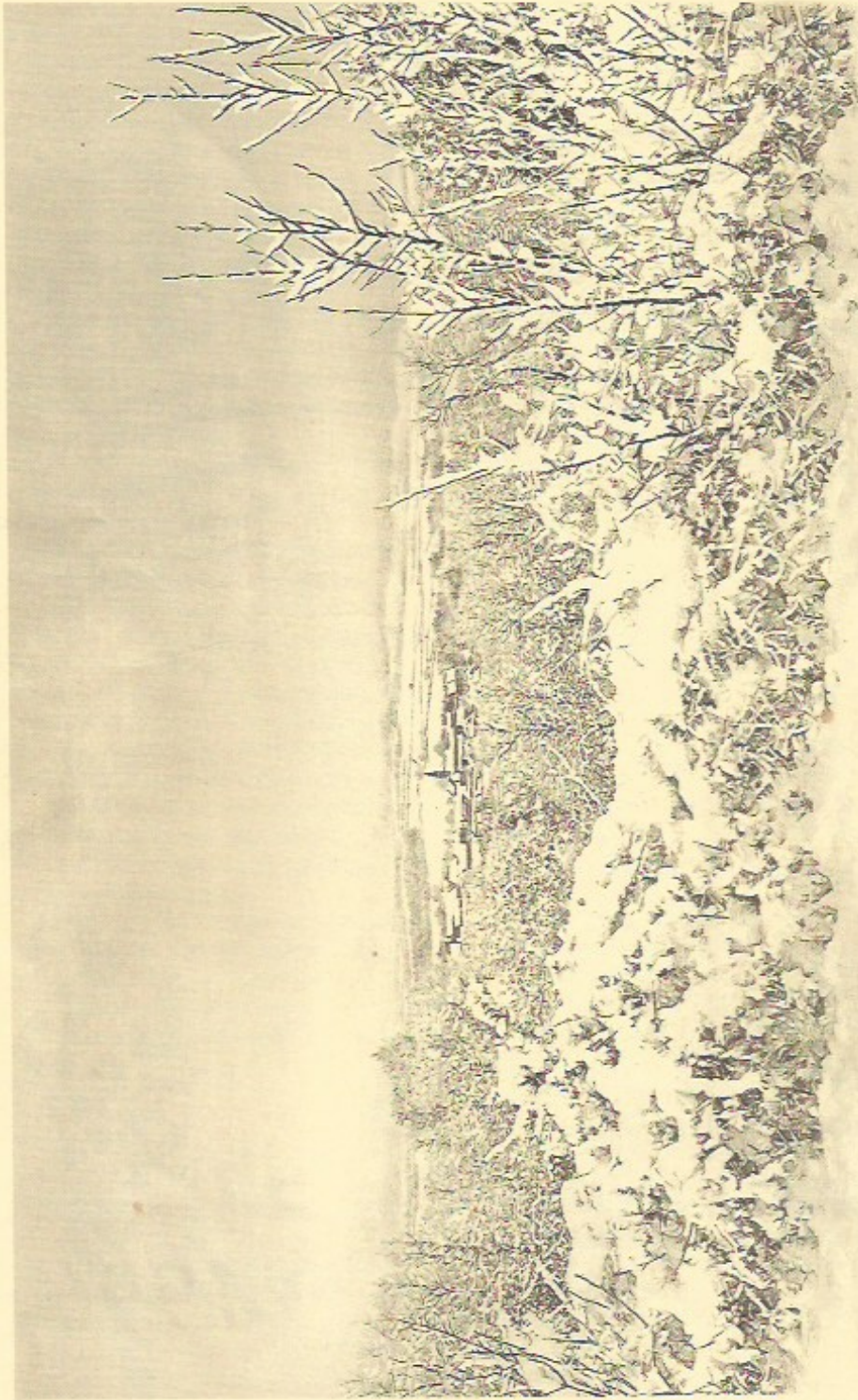
VEROSVRES SOUS LA NEIGE - Dessin Pierre ALBUSSON