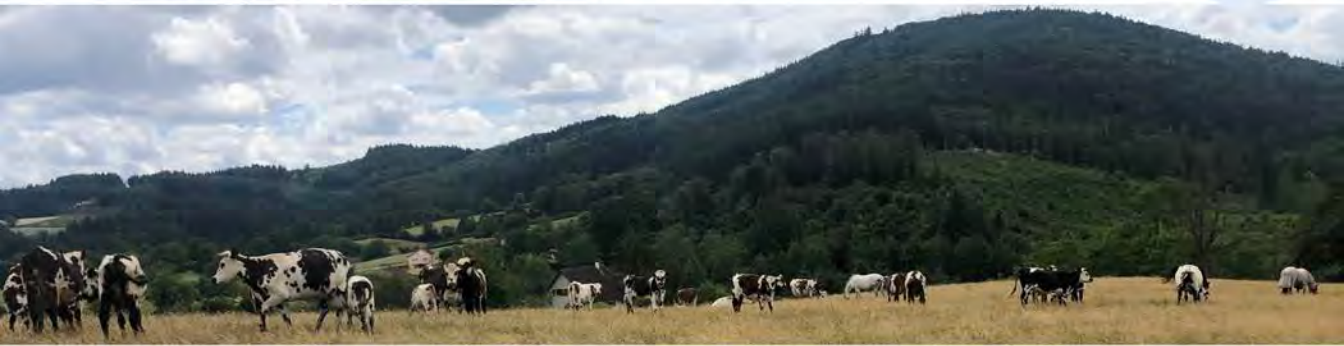
Diversification de l'élevage avec la production de fromages et de beurre, d'œufs et de viande de mouton