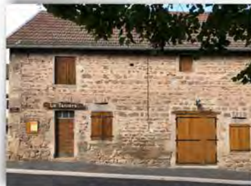
La tanière des chasseurs

De nombreuses activités animent la vie des Vroulons tout au long de l'année. On peut dire qu'il y en a pour tous les goûts et tous les âges. Entre la danse, la country, la gymnastique, ou encore le club des aînés pour jouer aux cartes ou au Scrabble, la dictée, le club de lecture, la bibliothèque, la marche, la pause café qui ont lieu toutes les semaines ou tous les mois. Et d'autres à fréquence annuelle, comme le loto, la soirée conférence, les concours de tarot et de manille, la tête de veau des chasseurs, qui rassemblent également beaucoup de monde.