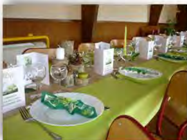
Chaque année, une belle table pour le repas des aînés