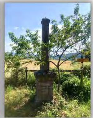
La croix des Ducs