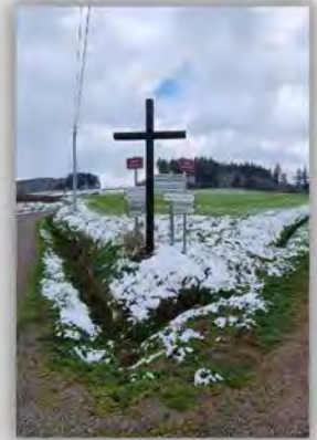
Les Champs Paillys