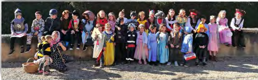
Le carnaval - 2019