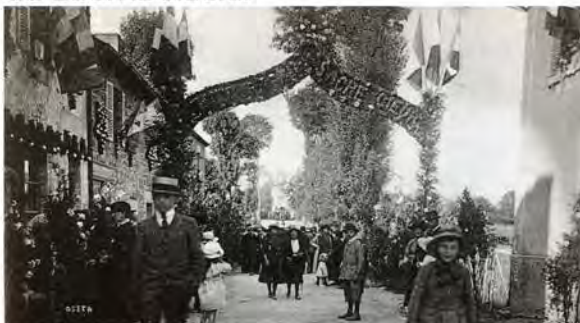
Fête au Bourg en l'honneur de Ste Marguerite-Marie - 1921

La fête des Bruyères avait lieu au moment des foires mais elle s'est arrêtée au début du 20ème siècle.