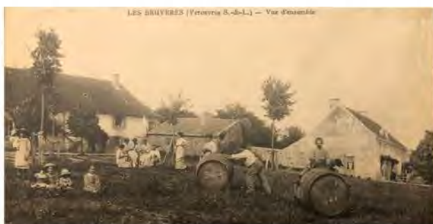
Fête aux Bruyères