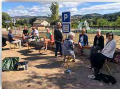
La pause café du jeudi - été 2022