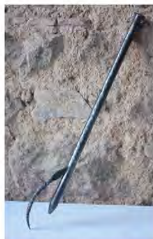
La forge vroulonne