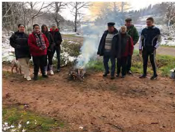
Le ravitaillement malgré le froid