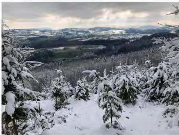
avril 2022 sous la neige

Cette randonnée ouverte à tous permet de sillonner la campagne et les bois alentours. En 2022 a eu lieu sa 44ème édition dans une ambiance hivernale contrastant avec les champs verdoyants et les fleurs naissantes qui caractérisent cette marche de printemps.